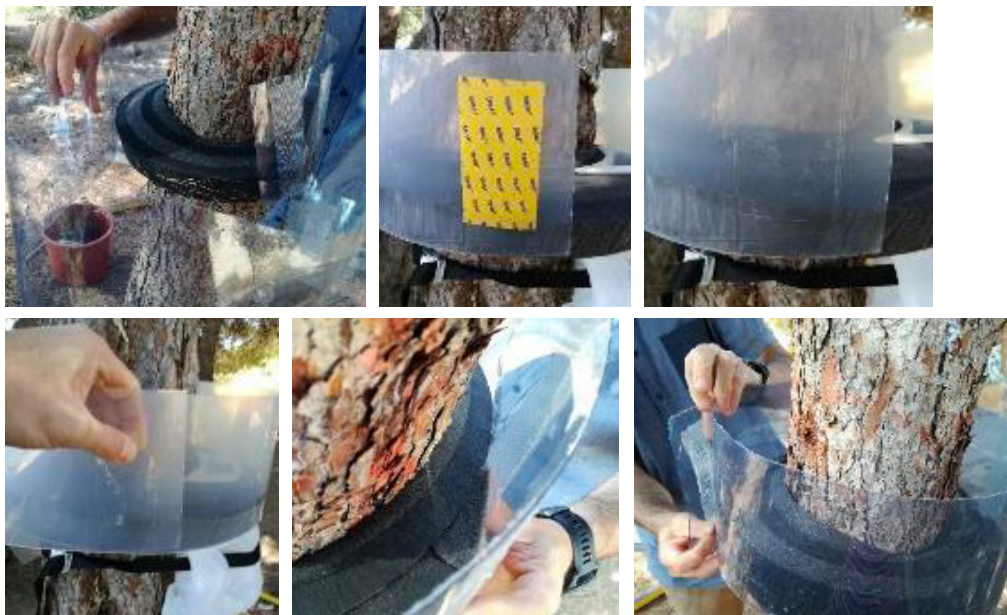
Apparence du piège PROCESSatrap collier installé :