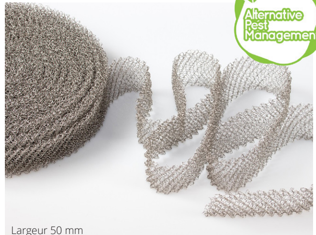
Largeur 50 mm