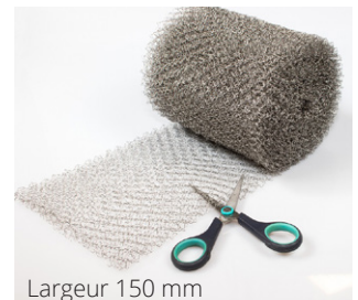
Largeur 150 mm