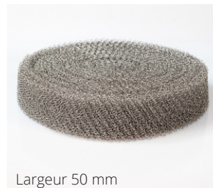
Largeur 50 mm