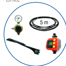
Kit CO 2 1 piège

Permet de raccorder 3 pièges BG-PROTECTOR