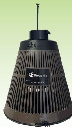
Réf I4050 : BG-PROTECTOR Unité

le BG-GAT cible les moustiques à la recherche d'un lieu de ponte tandis que le BG-PROTECTOR cible les moustiques tigres à la recherche d'un repas de sang.