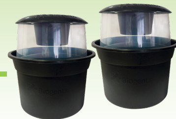
Réf I4052 : BG-GAT Carton de 12 pièges et 60 sticky cards