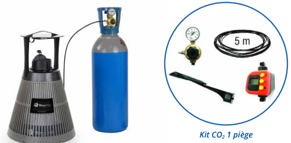
Kit CO 2 1 piège

*Nous recommandons d'utiliser des bouteilles de 10 kg comme source de CO 2 pour une utilisation extérieure permanente.